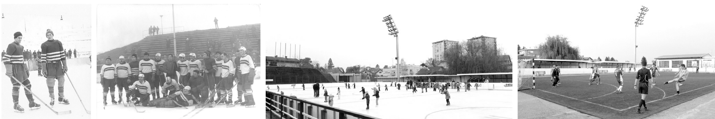
POLAZIŠTE - posebnost karaktera športske površine na otvorenom - očuvanje povezanosti sa okolinom i omogućavanje kvalitetne dnevne svetlosti u najvećoj mogućoj mjeri