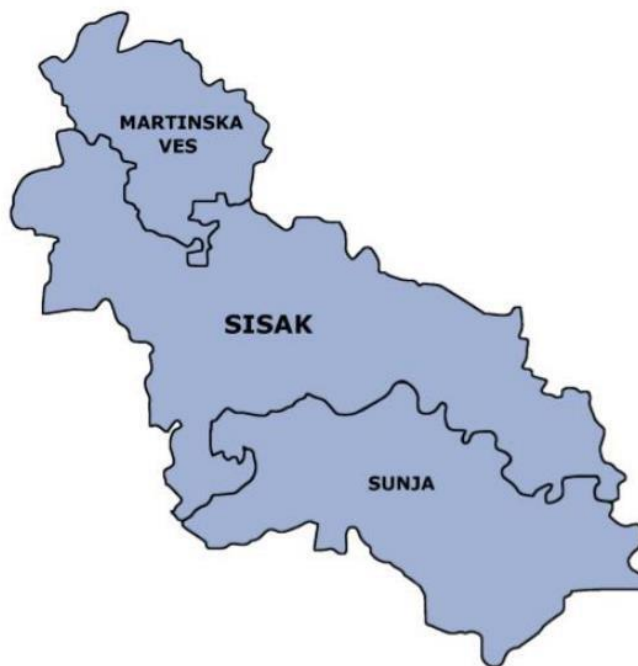
Slika 1. Kartografski prikaz Urbanog područja Sisak