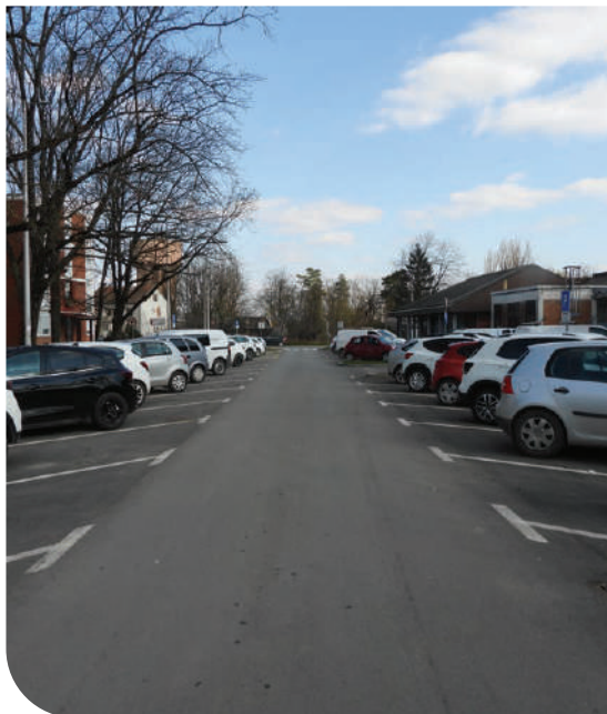
Asfaltirano parkiralište u Cesarčevoj ulici.