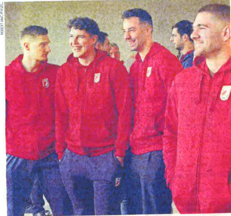
RUKOMETASII HRVATSKE bili su dobro raspoloženi na okupljanju, slijede završne pripreme u Prelogu i Zagrebu, ali i dvije pripremne utakmice