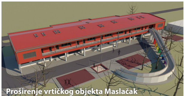
Proširenje vrtićkog objekta Maslačak

U Proračun Grada Siska za 2024. godinu ugrađeno je i povećanje osnovice od 15% odgojiteljicama u vrtićima, radnicima komunalnih službi i na zbrinjavanju otpada, vozačima Auto prometa te radnicima gradskog sustava. Time će se ublažiti inflatorni udar koji je u proteklom vremenu povećao troškove života.