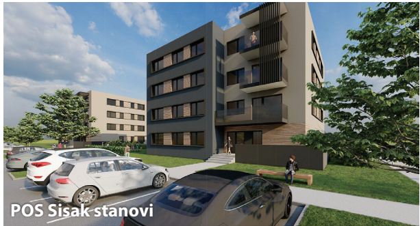
POS Sisak stanovi

grad će dobiti novo i moderno opremljeno kino i kazalište.