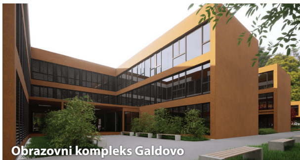
Obrazovni kompleks Galdovo

Nakon što je ove godine, kao tek šesti grad u RH, Sisak uveo potporu za medicinski pomognutu oplodnju, Sisak će dobiti još jednu mjeru koja će pomoći najranjivijim građanima Siska.