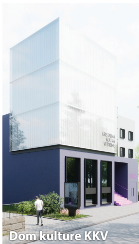
Dom kulture KKV

Tri su najvažnija projekta u kulturi koji se nalaze u proračunu za 2024. godinu nova knjižnica, novo kino i novo kazalište. Rekonstrukcijom bivše zgrade banke u samom centru grada na Trgu Ljudevita Posavskog 1, Sisak će prvi put dobiti modernu knjižnicu s najsuvremenijim sadržajima za sve generacije Sišćana. Cjelovitom obnovom Kazališta 21 i Kristalne kocke vedrine