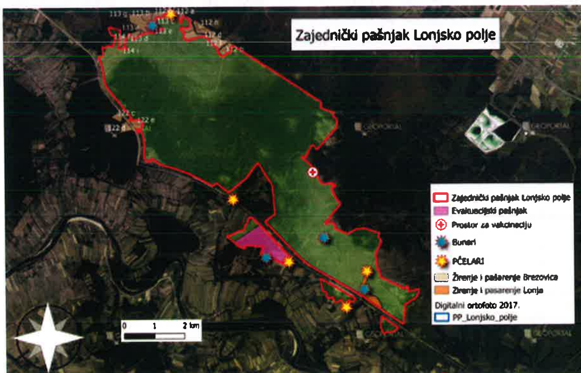
Karta 2. Kartografski prikaz infrastrukture na ZP Lonjsko polje

Prema Programu gospodarenja gospodarskom jedinicom „Lonja“ sa planom upravljanja područjem ekološke mreže od 2018. – 2027. godine žirenje i pašarenje je dozvoljeno u odsjecima 52a i 52f.