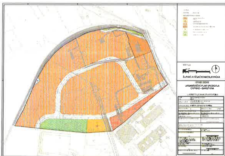
Izvod iz Urbanističkog plana uređenja „Caprag-Barutana“ (plan namjene površina)