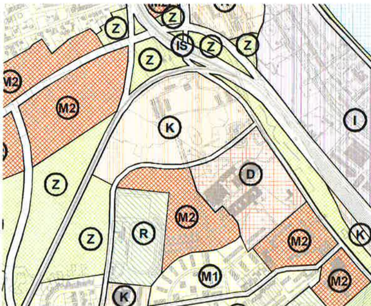
Izvod iz Generalnog urbanističkog plana grada Siska