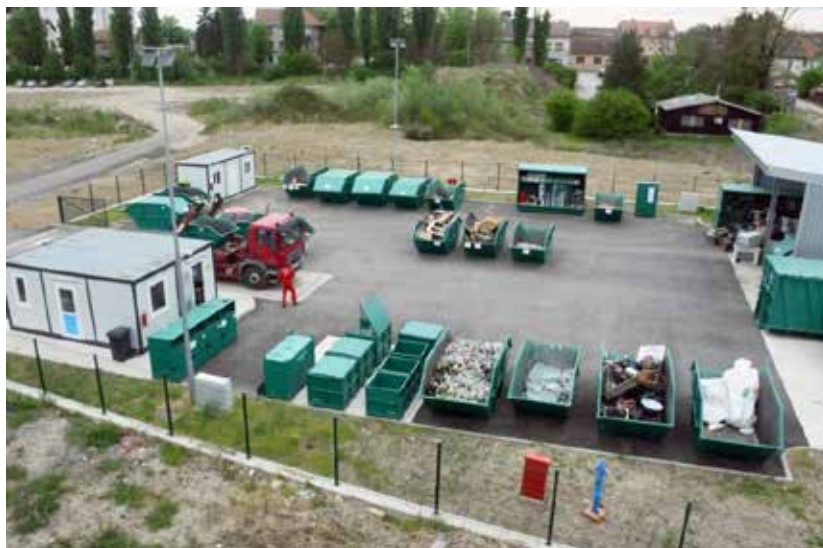
Slika 9. Reciklažno dvorište Sisak Stari