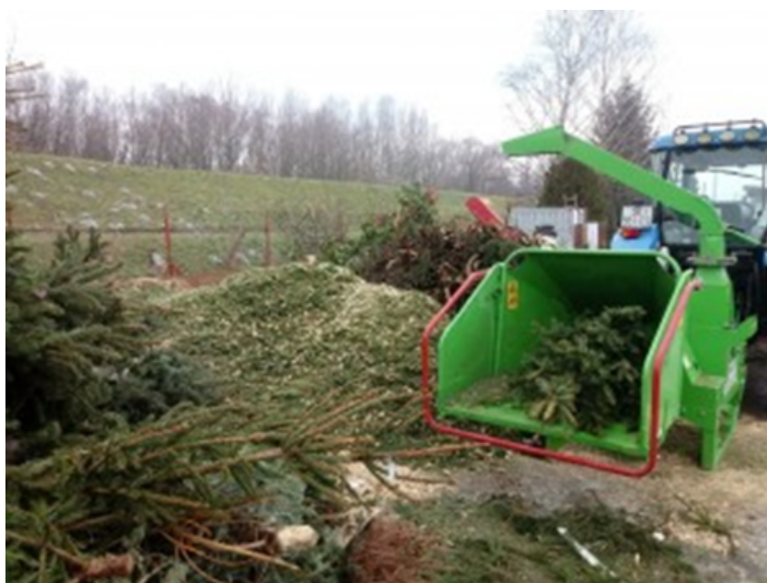
Slika 10. Odbačene drvene sječke i izrezivanje u drobilici za proizvodnju sječke