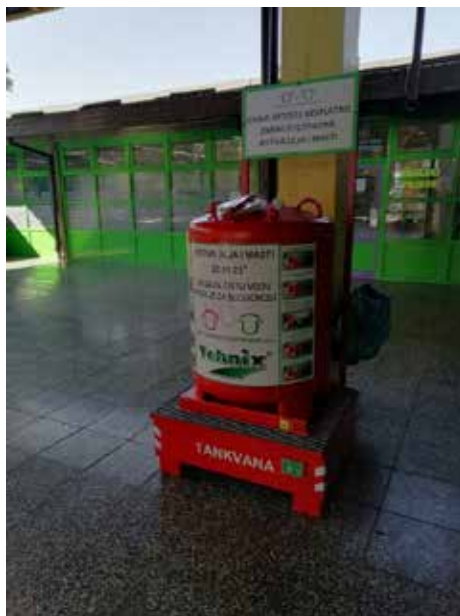
Slika 8. Spremnik za odlaganje jestivih ulja i masti

Na glavnim ulazima Gradske tržnice u Sisku, kao i na tržnici u Capragu postavljeni su spremnici od 500 litara u koji se mogu odložiti jestiva ulja i masti. GOS je u 2018. godini započeo suradnju s restoranima, fast food-ovima i raznim ugostiteljima u svrhu skupljanja otpadnih jestivih ulja i masti. Ta suradnja pokazala se vrlo uspješnom tako da je GOS tu uslugu odlučio približiti i građanima grada Siska.