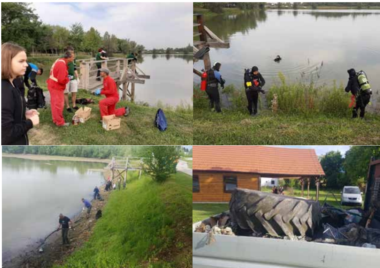
Slika 4. Zelena čistka na području Grada Siska

Grad Sisak je prepoznao važnost kampanje Zelena čistka kao važan korak u promjeni odnosa građana prema primarnom odvajanju otpada i saniranju postojećih lokacija odbačenog otpada. Podupiranjem kampanje omogućuje se aktivno uključivanje građana u rješavanje problema vezanog uz očuvanje okoliša i prirode te se isto tako stvara dodatan iskorak koji pridonosi kvalitetnijem dijalogu s građanima. Dana 19. rujna 2020. godine u Sisku je provedena ekološka akcija Zelena čistka , a lokacija čišćenja je bila Ciglarska graba.