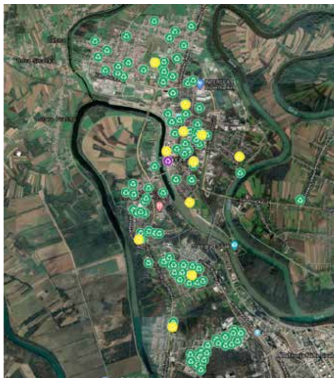
Slika 5. Lokacije zelenih otoka na području grada Siska