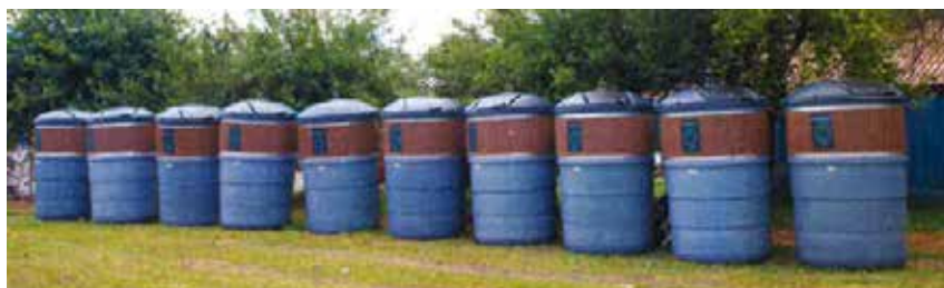
Slika 6. Nabavljeni polupodzemni spremnici

Dana 19. lipnja 2020. godine u Sisak je stigla prva pošiljka polupodzemnih spremnika koji će zamijeniti sve dotrajale nadzemne spremnike zapremine 5.000 litara koje koriste građani u stambenim zgradama. GOS je nabavio 94 komada polupodzemnih spremnika zapremine 5.000 litara i 7 komada polupodzemnih spremnika zapremine 2.500 litara. Vrijednost projekta iznosi 2.318.253,75 kn s PDV-om. Prednost polupodzemnih spremnika u odnosu na stare nadzemne spremnike je jednostavnost korištenja, ušteda prostora, brzo i efikasno pražnjenje i što je najvažnije visoka razina higijene i sprječavanje širenja neugodnih mirisa. Polupodzemni spremnici predstavljaju najsuvremeniji način za sigurno odlaganje i sakupljanje otpada.