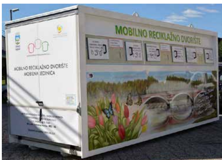
Slika 12. Mobilno reciklažno dvorište

Tvrtka GOS posjeduje mobilno reciklažno dvorište, a raspored lokacije redovito objavljuje na svojoj internet stranici.