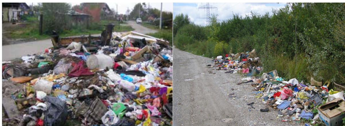
Slika 3. Odbačeni otpad na lokaciji Capraške poljane

Kroz 2020. godinu, tvrtka Gospodarenje otpadom Sisak d.o.o. 56 je puta izašla na razne lokacije u svrhu čišćenja divljih odlagališta čišćenjem divljih odlagališta. Skupljeno je i zbrinuto gotovo 156 tona nepropisno odloženog otpada što i dalje nastavlja biti jedan od problema gospodarenja otpadom u Gradu Sisku.