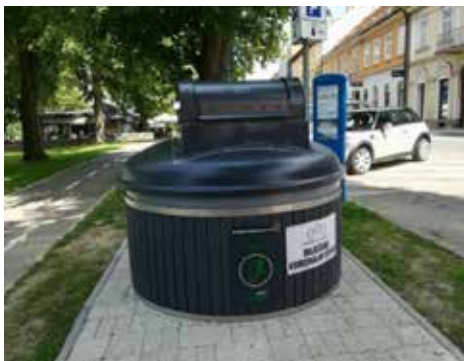
Slika 7. Postavljeni polupodzemni spremnik na lokaciji

U rujnu 2020. godine započelo je ukapanje i postavljanje prvih polupodzemnih spremnika na unaprijed određene lokacije u gradu Sisku. Uz već spomenute pozitivne strane odlaganja otpada u polupodzemne spremnike, na poklopce su ugrađene i elektronske brave/čitači s integriranim LCD ekranom za prikaz informacija. Elektronska brava omogućava kontrolu pristupa i otključava se pomoću RFID kartice. Beskontaktne RFID kartice (Radio-Frequency IDentification) nemaju fizički kontakt s čitačem nego se komunikacija između kartice i čitača odvija radio signalom. RFID kartica povezana je s korisnikom koji će istu dobiti na korištenje što znači da će se svako otključavanje spremnika registrirati u sustavu te da će se prikupljati informacije o tome tko je i kada odlagao otpad. Svrha zaključavanja spremnika je kontrolirati pristup i korištenje kako bi se neovlaštenim osobama onemogućilo odlaganje otpada u spremnik koji im nije namijenjen. Zaključno s 31. 12. 2020. godine ukopano je i postavljeno sveukupno 28 polupodzemnih spremnika od ukupno 94 nabavljenih. Ostatak spremnika biti će postavljen tokom 2021. godine.