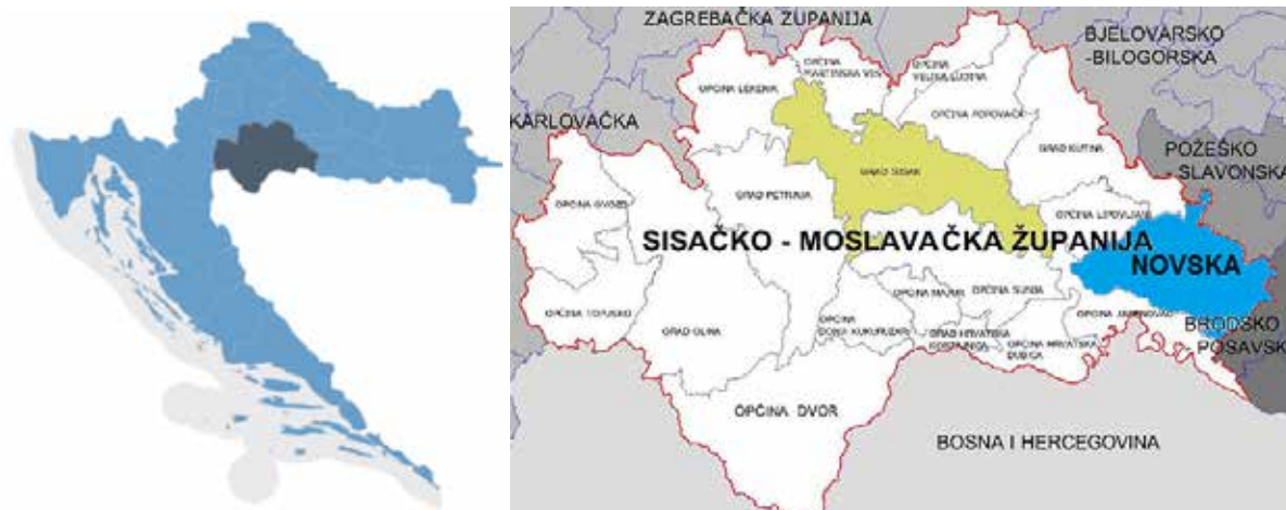
Slika 2. Položaj Sisačko-moslavačke županije unutar granica RH (lijevo) i položaj Grada Siska unutar Sisačko-moslavačke županije (desno)

Područje Grada Siska nalazi se u Sisačko-moslavačkoj županiji koja zauzima jugoistočni dio sjeverozapadne Hrvatske. Područje Grada Siska prostire se 45 km u smjeru sjeverozapad-jugoistok uzduž rijeka Save, Kupe, Odre i Lonje te zahvaća krajnji jugoistočni dio Turopolja i jugozapadni dio Lonjskog polja, a graniči sa sljedećim jedinicama lokalne samouprave; sa sjevera općinama Martinska Ves, Velika Ludina i Popovača i Gradom Kutinom, s istoka općinama Lipovljani i Jasenovac, s juga općinama Sunja i Mečenčani i Gradom Petrinjom te sa zapada općinom Lekenik. Grad Sisak zaprema površinu od 422,75 km 2 i čini 9,5% površine Sisačko-moslavačke županije, odnosno 0,75% površine države.