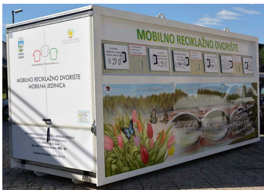
Slika 9. Mobilno reciklažno dvorište

Tvrtka GOS posjeduje mobilno reciklažno dvorište, a raspored lokacije redovito objavljuje na svojoj internet stranici.