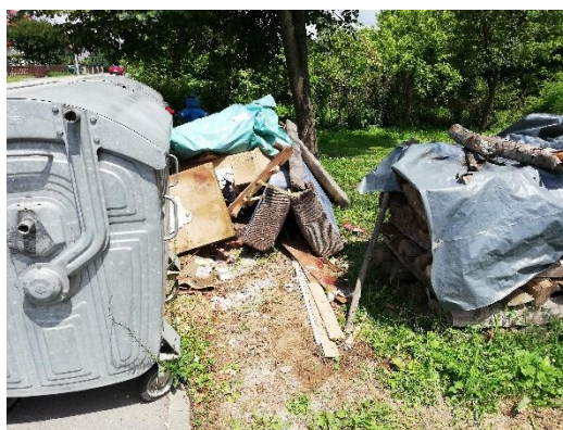
Slika 4. Odbačeni otpad oko kontejnera iz Ulice Miroslava Kraljevića

Kroz 2019. godinu, tvrtka Gospodarenje otpadom Sisak d.o.o. 47 je puta izašla na razne lokacije u svrhu čišćenja divljih odlagališta. Neke od lokacija su: Palanjek, Topolovac, Naselje, Prelošćica, Tomčev put, Zeleni brijeg, gdje je sakupljeno oko 68 t nepropisno odloženog otpada. Uz navedene lokacije čistila su se i područja oko spremnika za miješani komunalni otpad gdje su sakupili gotovo 38 t nepropisno odloženog otpada.