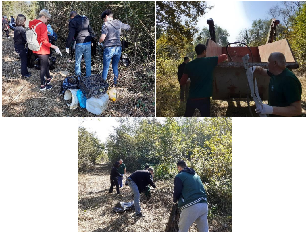
Slika 5. Zelena čistka na području Grada Siska

Grad Sisak je prepoznao važnost kampanje Zelena čistka kao važan korak u promjeni odnosa građana prema primarnom odvajanju otpada i saniranju postojećih lokacija odbačenog otpada. Podupiranjem kampanje omogućuje se aktivno uključivanje građana u rješavanje problema vezanog uz očuvanje okoliša i prirode te se isto tako stvara dodatni iskorak koji pridonosi kvalitetnijem dijalogu s građanima. Dana 21. rujna 2019. godine u Sisku je provedena ekološka akcija Zelena čistka , a lokacija čišćenja je bila potez od Tehničke škole Sisak do Barutane. U akciji je sakupljeno 760 kg glomaznog otpada.