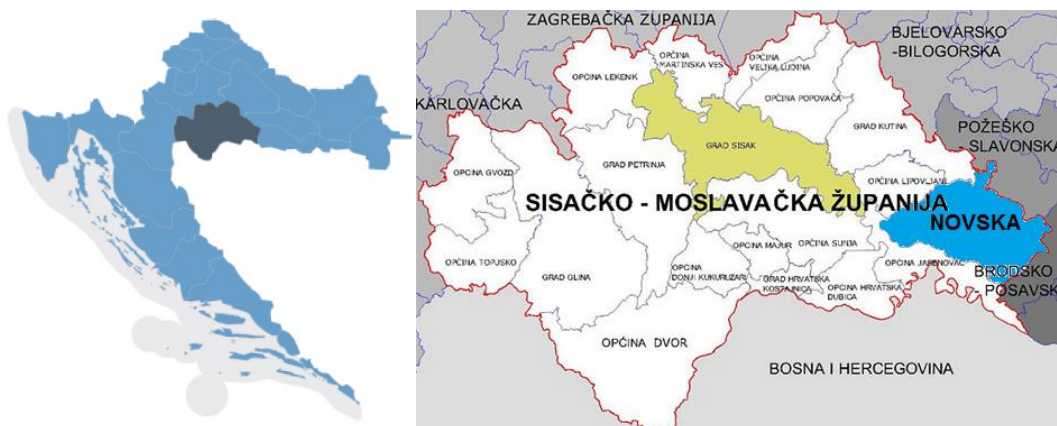
Slika 2. Položaj Sisačko-moslavačke županije unutar granica RH (lijevo) i položaj Grada Siska unutar Sisačko-moslavačke županije (desno) (Izvor: Plan gospodarenja otpadom; Grad Sisak 2017.-2022.)

Područje Grada Siska nalazi se u Sisačko-moslavačkoj županiji koja zauzima jugoistočni dio sjeverozapadne Hrvatske. Područje Grada Siska prostire se 45 km u smjeru sjeverozapad-jugoistok uzduž rijeka Save, Kupe, Odre i Lonje te zahvaća krajnji jugoistočni dio Turopolja i jugozapadni dio Lonjskog polja, a graniči sa sljedećim jedinicama lokalne samouprave; sa sjevera općinama Martinska Ves, Velika Ludina i Popovača i Gradom Kutinom, s istoka općinama Lipovljani i Jasenovac, s juga općinama Sunja i Mečenčani i Gradom Petrinjom te sa zapada općinom Lekenik. Grad Sisak zaprema površinu od 422,75 km 2 i čini 9,5% površine Sisačko-moslavačke županije, odnosno 0,75% površine države.