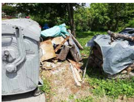
Slika 4. Odbačeni otpad oko kontejnera iz Ulice Miroslava Kraljevića

Kroz 2019. godinu, tvrtka Gospodarenje otpadom Sisak d.o.o. 47 je puta izašla na razne lokacije u svrhu čišćenja divljih odlagališta. Neke od lokacija su: Palanjek, Topolovac, Naselje, Prelošćica, Tomčev put, Zeleni brijeg, gdje je sakupljeno oko 68 t nepropisno odloženog otpada. Uz navedene lokacije čistila su se i područja oko spremnika za miješani komunalni otpad gdje su sakupili gotovo 38 t nepropisno odloženog otpada.