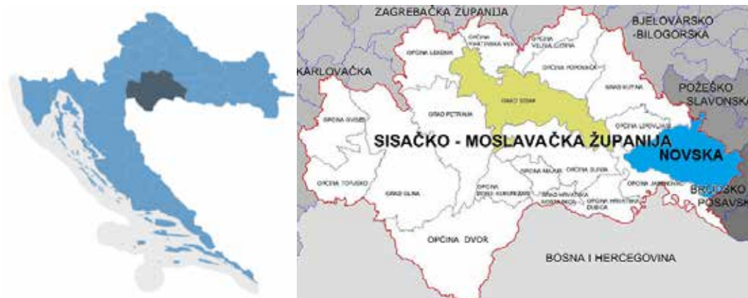
Slika 2. Položaj Sisačko-moslavačke županije unutar granica RH (lijevo) i položaj Grada Siska unutar Sisačko-moslavačke županije (desno)