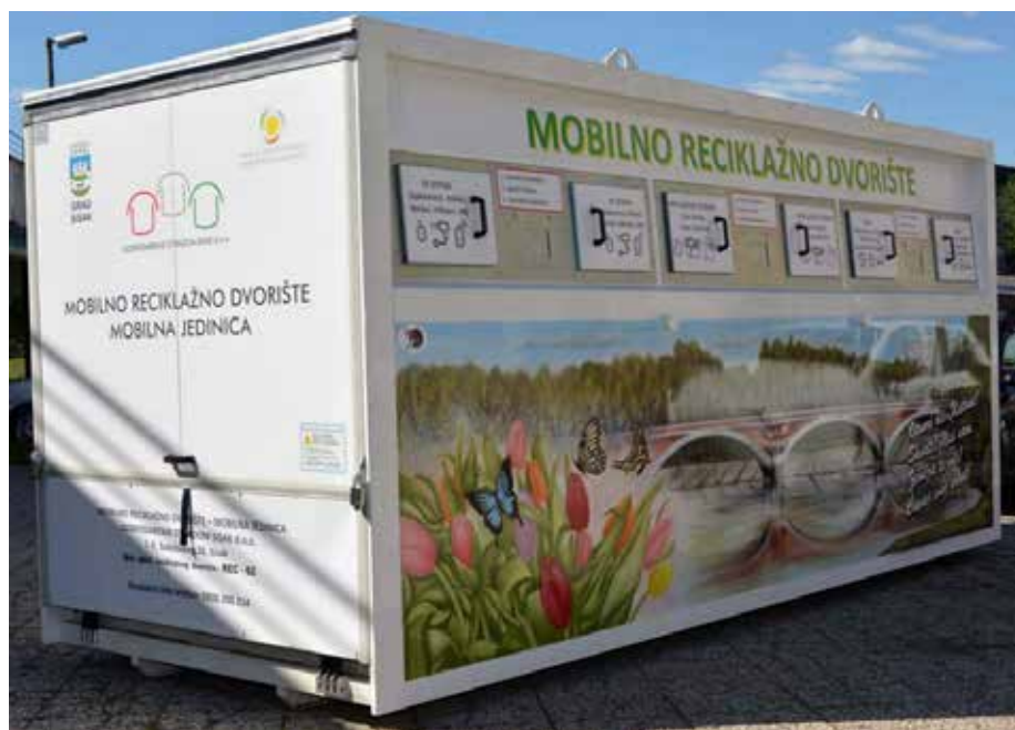
Slika 9. Mobilno reciklažno dvorište

Tvrtka GOS posjeduje mobilno reciklažno dvorište, a raspored lokacije redovito objavljuje na svojoj internet stranici.