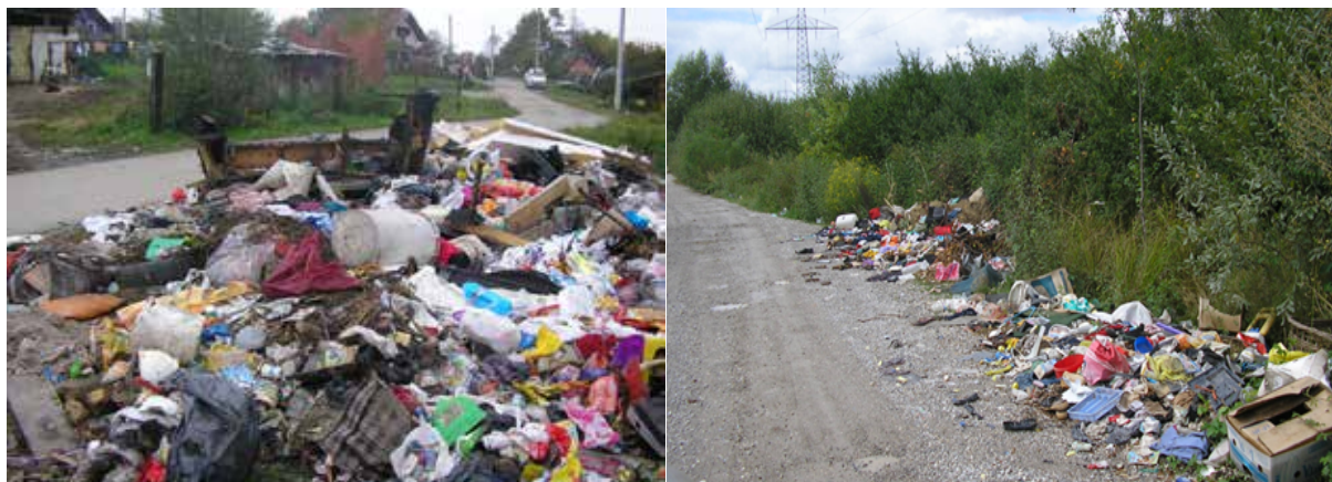
Slika 3. Odbačeni otpad na lokaciji Capraške poljane