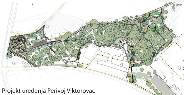
Projekt uređenja Perivoj Viktorovac