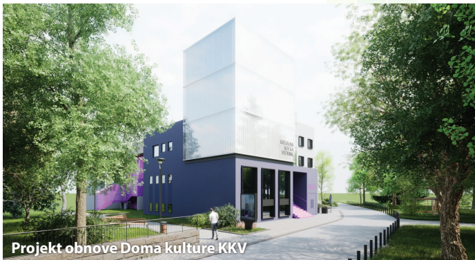
Projekt obnove Doma kulture KKV

Tri najvažnija projekta u kulturi su nova knjižnica, novo kino i novo kazalište. Rekonstrukcijom bivše zgrade banke u samom centru grada na Trgu Ljudevita Posavskog 1, Sisak će prvi put dobiti modernu knjižnicu s najsuvremenijim sadržajima za sve generacije Sišćana. Cjelovitom obnovom Kazališta 21 i Kristalne kocke vedrine grad će dobiti novo i moderno kino i kazalište.