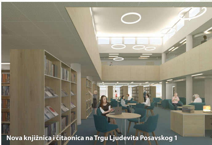
Nova knjižnica i čitaonica na Trgu Ljudevita Posavskog 1

Od 2022. godine Grad sufinancira djelatnosti obrta za obavljanje djelatnosti dadilje. Grad Sisak će sufinancirati troškove čuvanja, brige i skrbi o djeci rane i predškolske dobi. Djeca za koju se ostvaruje pravo na sufinanciranje su djeca u dobi od navršenih šest mjeseci života do polaska u osnovnu školu.