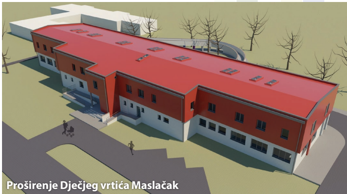
Proširenje Dječjeg vrtića Maslačak

Tri najvažnija projekta u kulturi su nova knjižnica, novo kino i novo kazalište. Rekonstrukcijom bivše zgrade banke u samom centru grada na Trgu Ljudevita Posavskog 1, Sisak će prvi put dobiti modernu knjižnicu s najsuvremenijim sadržajima za sve generacije Sišćana. Cjelovitom obnovom Kazališta 21 i Kristalne kocke vedrine grad će dobiti novo i moderno kino i kazalište.