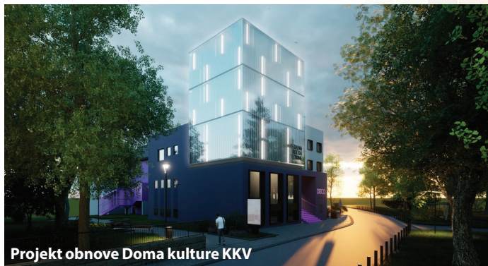
Projekt obnove Doma kulture KKV

Sisak je 2024. prvi puta dobio prostran, moderan i suvremeno opremljen objekt knjižnice na Trgu Ljudevita Posavskog 1. Cjelovitom obnovom Kazališta 21 i Kristalne kocke vedrine grad će dobiti novo i moderno kino i kazalište.