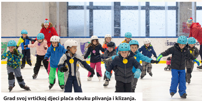
Grad svoj vrtićkoj djeci plaća obuku plivanja i klizanja.

Godine 2022. započeo je projekt „Vrtić po mjeri obitelji“, kojim je roditeljima s radnim vremenom izvan uobičajenog vrtićkog radnog vremena, pružena mogućnost da njihova djeca imaju skrb i prehranu do 20:00 sati svakog radnog dana. Osim te pogodnosti, vrtići su dodatno opremljeni, a odgajatelji educirani za napredne programe rada s djecom.