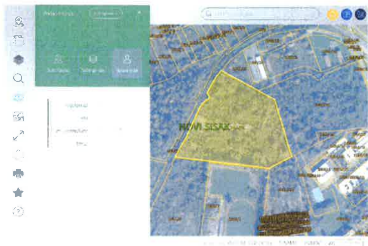
Izvod iz katastra