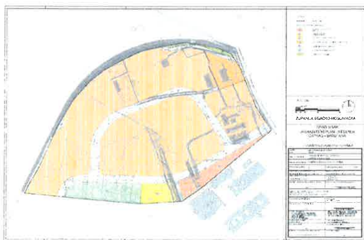
Izvod iz Urbanističkog plana uređenja „Caprag-Barutana“ (plan namjene površina)