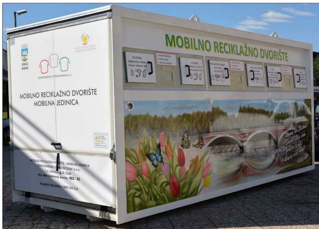
Slika 2. Mobilno reciklažno dvorište