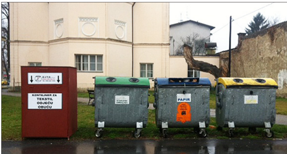
Slika 3. »Zeleni otok«

Lokacije »zelenih otoka« moguće je pronaći na internet stranici tvrtke GOS kako je prikazano na sljedećoj slici.