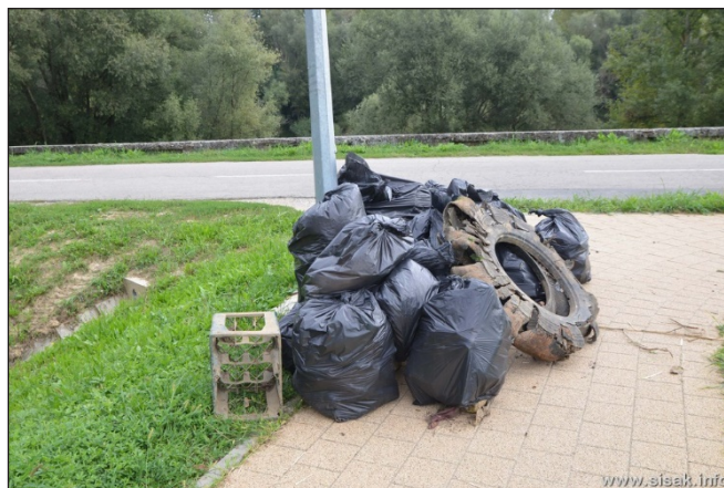
Slika 7. Zelena čistka na području Starog grada

U sklopu iste akcije održana je i Plava čistka na Jadranskom moru. Pod pokroviteljstvom Grada Siska, Športsko rekreacijskog centra Sisak i Općine Gradac, Ronilački klub Sisak je organizirao akciju »Eko Sisak u Zaostrogu«. Tijekom ove akcije 30-ak ronioaca je sudjelovalo u čišćenju podmorja dijela akvatorija ispred Odmarališta Zaostrog.