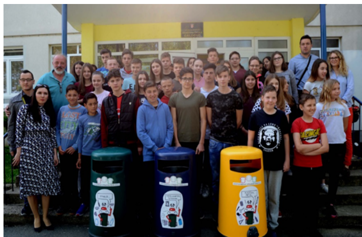
Slika 12. Nagrada (spremnici za odvojeno sakupljanje otpada) OŠ Galdovo na najvećoj količini sakupljenog papira

Četiri osnovne škole koje su imale najviše sakupljenog papira i kartona dobile su na raspolaganje po jedan »zeleni otok« (set od tri spremnika za korisni otpad) koji mogu biti smješteni u prostoru škole ili pretprostoru škole. Ovom prilikom čestitamo OŠ Braće Bobetko, OŠ Braća Ribar, OŠ 22. lipnja i posebno OŠ Galdovo koja je imala najveću količinu sakupljenog papira na osvojenim spremnicima.