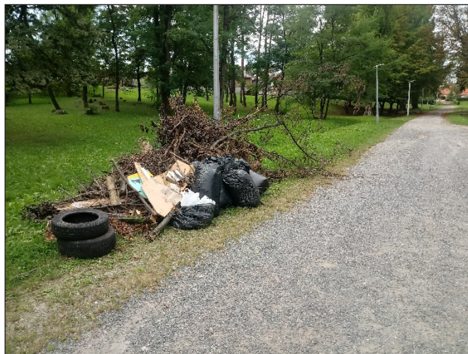
Slika 6. Zelena čistka na području park šume Viktorovac