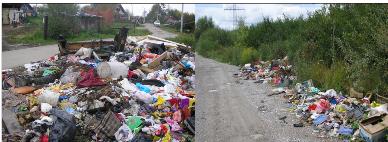
Slika 5. Odbačeni otpad na lokaciji Capraške poljane

Uklanjanje odbačenog otpada je tijekom 2018. godine provedeno u skladu s prijavama komunalnih redara i građana te kroz redovan odvoz miješanog komunalnog otpada, ukoliko su lokacije odbačenog otpada bile pozicionirane uz same posude za sakupljanje miješanog komunalnog otpada te je sastav otpada bio takav da ga se moglo odvesti u redovnoj liniji sakupljanja otpada.