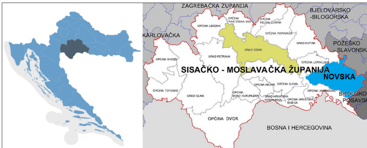
Slika 1. Položaj Sisačko-moslavačke županije unutar granica RH (lijevo) i položaj Grada Siska unutar Sisačko-moslavačke županije (desno)

Područje Grada Siska nalazi se u Sisačko-moslavačkoj županiji koja zauzima jugoistočni dio sjeverozapadne Hrvatske. Područje Grada Siska prostire se 45 km u smjeru sjeverozapad-jugoistok uzduž rijeka Save, Kupe, Odre i Lonje te zahvaća krajnji jugoistočni dio Turopolja i jugozapadni dio Lonjskog polja, a graniči sa sljedećim jedinicama lokalne samouprave; sa sjevera općinama Martinska Ves, Velika Ludina i Popovača i Gradom Kutinom, s istoka općinama Lipovljani i Jasenovac, s juga općinama Sunja i Mečenčani i Gradom Petrinjom te sa zapada općinom Lekenik. Grad Sisak zaprema površinu od 422,75 km 2 i čini 9,5% površine Sisačko-moslavačke županije, odnosno 0,75% površine države.