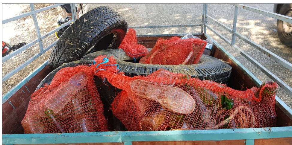
Slika 8. Plava čistka akvatorija ispred Odmarališta Zaostrog

U sklopu iste akcije održana je i Plava čistka na Jadranskom moru. Pod pokroviteljstvom Grada Siska, Športsko rekreacijskog centra Sisak i Općine Gradac, Ronilački klub Sisak je organizirao akciju »Eko Sisak u Zaostrogu«. Tijekom ove akcije 30-ak ronioaca je sudjelovalo u čišćenju podmorja dijela akvatorija ispred Odmarališta Zaostrog.