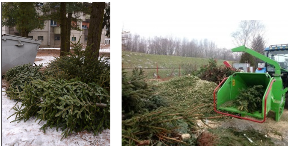
Slika 9. Odbačene drvene sječke i izrezivanje u drobilici za proizvodnju sječke