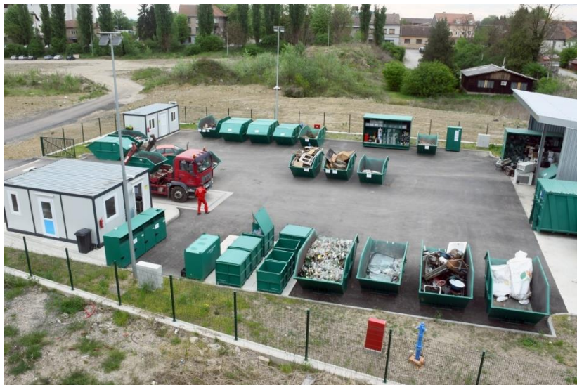
Slika 9. Reciklažno dvorište Sisak Stari

Tijekom 2020. godine reciklažno dvorište Sisak Stari posjećeno je 5.448 puta od strane korisnika usluga tvrtke GOS, koji su odložili ukupno 505 tona različitih vrsta otpada.