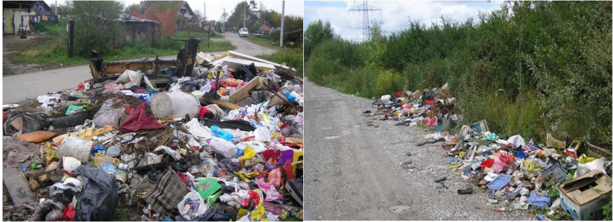
Slika 3. Odbačeni otpad na lokaciji Capraške poljane

Kroz 2020. godinu, tvrtka Gospodarenje otpadom Sisak d.o.o. 56 je puta izašla na razne lokacije u svrhu čišćenja divljih odlagališta čišćenjem divljih odlagališta. Skupljeno je i zbrinuto gotovo 156 tona nepropisno odloženog otpada što i dalje nastavlja biti jedan od problema gospodarenja otpadom u Gradu Sisku.