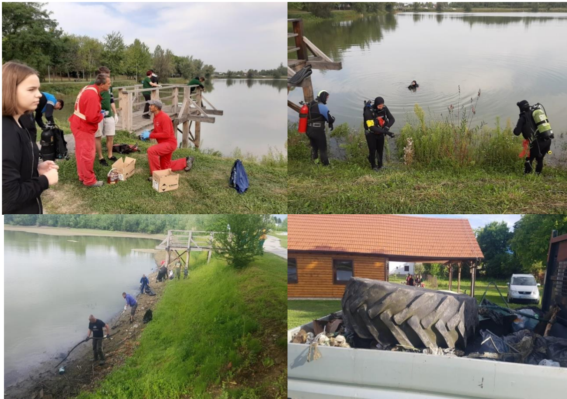
Slika 4. Zelena čistka na području Grada Siska