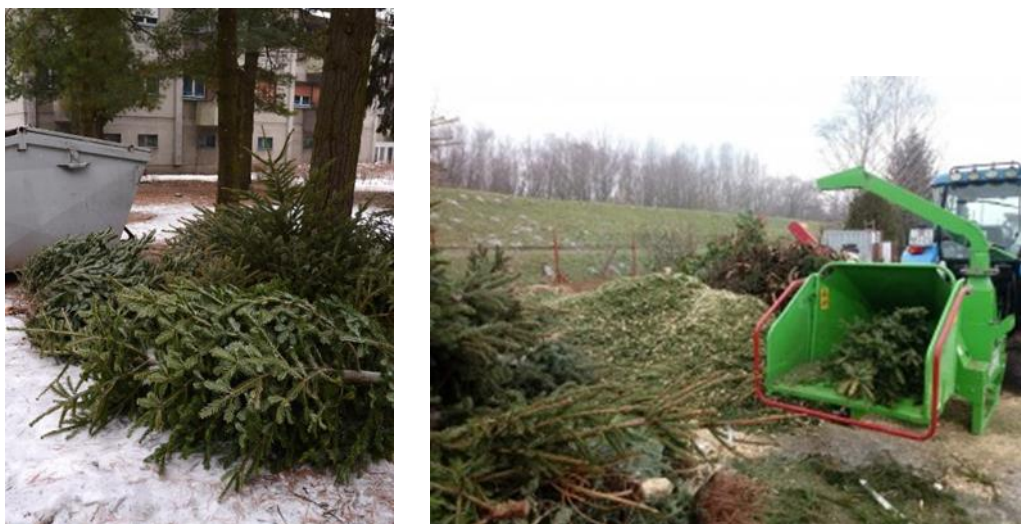
Slika 10. Odbačene drvene sječke i izrezivanje u drobilici za proizvodnju sječke

U tjednu od 08.-15. siječnja 2020. godine tvrtka GOS sakupljala je odbačena božićna drvca. Sakupljena odbačena božićna drvca drobila su se u drvenu sječku koja se dalje koristi kao biomasa za proizvodnju topline. Korisnici su putem web stranice www.gos.hr i putem njihovih društvenih mreža bili educirani o ovom postupku te o činjenici da odbačena drvca ne smiju odlagati unutar spremnika za otpad jer se drva ne odlažu na odlagalište već se oporabljaju u energiju.