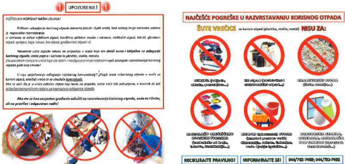
Slika 13. Uputa korisnicima usluga tvrtke Gospodarenje otpadom Sisak d.o.o. kako razvrstavati korisni otpad

Tijekom 2020. godine tvrtka GOS upozoravala je korisnike na greške u razvrstavanju korisnog otpada te su im upute i obavijesti slali uz račune za redovni odvoz miješanog komunalnog otpada.