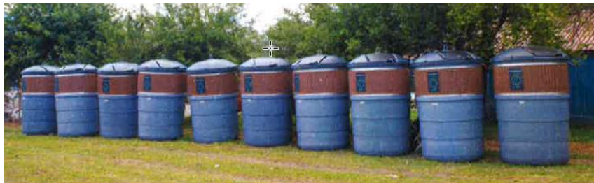
Slika 6. Nabavljeni polupodzemni spremnici

Dana 19. lipnja 2020. godine u Sisak je stigla prva pošiljka polupodzemnih spremnika koji će zamijeniti sve dotrajale nadzemne spremnike zapremine 5.000 litara koje koriste građani u stambenim zgradama. GOS je nabavio 94 komada polupodzemnih spremnika zapremine 5.000 litara i 7 komada polupodzemnih spremnika zapremine 2.500 litara. Vrijednost projekta iznosi 2.318.253,75 kn s PDV-om. Prednost polupodzemnih spremnika u odnosu na stare nadzemne spremnike je jednostavnost korištenja, ušteda prostora, brzo i efikasno pražnjenje i što je najvažnije visoka razina higijene i sprječavanje širenja neugodnih mirisa. Polupodzemni spremnici predstavljaju najsuvremeniji način za sigurno odlaganje i sakupljanje otpada.