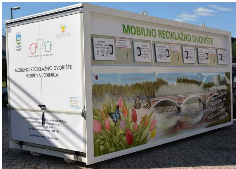
Slika 12. Mobilno reciklažno dvorište

Tvrtka GOS posjeduje mobilno reciklažno dvorište, a raspored lokacije redovito objavljuje na svojoj internet stranici.