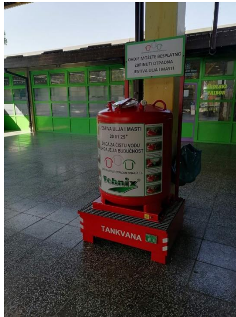
Slika 8. Spremnik za odlaganje jestivih ulja i masti

Na glavnim ulazima Gradske tržnice u Sisku, kao i na tržnici u Capragu postavljeni su spremnici od 500 litara u koji se mogu odložiti jestiva ulja i masti. GOS je u 2018. godini započeo suradnju s restoranima, fast food-ovima i raznim ugostiteljima u svrhu skupljanja otpadnih jestivih ulja i masti. Ta suradnja pokazala se vrlo uspješnom tako da je GOS tu uslugu odlučio približiti i građanima Grada Siska.