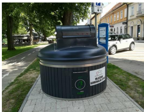
Slika 7. Postavljeni polupodzemni spremnik na lokaciji

U rujnu 2020. godine započelo je ukapanje i postavljanje prvih polupodzemnih spremnika na unaprijed određene lokacije u gradu Sisku. Uz već spomenute pozitivne strane odlaganja otpada u polupodzemne spremnike, na poklopce su ugrađene i elektronske brave/čitači s integriranim LCD ekranom za prikaz informacija. Elektronska brava omogućava kontrolu pristupa i otključava se pomoću RFID kartice. Beskontaktna RFID kartice (Radio-Frequency IDentification) nemaju fizički kontakt s čitačem nego se komunikacija između kartice i čitača odvija radio signalom. RFID kartica povezana je s korisnikom koji će istu dobiti na korištenje što znači da će se svako otključavanje spremnika registrirati u sustavu te da će se prikupljati informacije o tome tko je i kada odlagao otpad. Svrha zaključavanja spremnika je kontrolirati pristup i korištenje kako bi se neovlaštenim osobama onemogućilo odlaganje otpada u spremnik koji im nije namijenjen. Zaključno s 31.12.2020. godine ukopano je i postavljeno sveukupno 28 polupodzemnih spremnika od ukupno 94 nabavljenih. Ostatak spremnika biti će postavljen tokom 2021. godine.