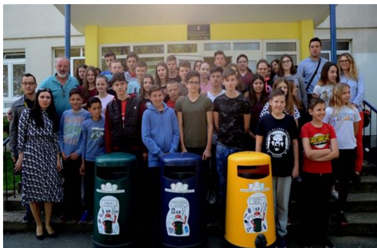
Slika 12. Nagrada (spremnici za odvojeno sakupljanje otpada) OŠ Galdovo na najvećoj količini sakupljanog papira

Četiri osnovne škole koje su imale najviše sakupljenog papira i kartona dobile su na raspolaganje po jedan “zeleni otok” (set od tri spremnika za korisni otpad) koji mogu biti smješteni u prostoru škole ili pretprostoru škole. Ovom prilikom čestitamo OŠ Braće Bobetko, OŠ Braća Ribar, OŠ 22. lipnja i posebno OŠ Galdovo koja je imala najveću količinu sakupljenog papira na osvojenim spremnicima.