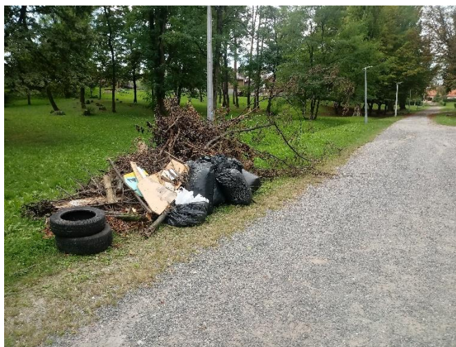
Slika 6. Zelena čistka na području park šume Viktorovac

Grad Sisak je prepoznao važnost kampanje Zelena čistka i Plava čistka kao važan korak u promjeni odnosa građana prema primarnom odvajanju otpada i saniranju postojećih lokacija odbačenog otpada. Podupiranjem kampanje omogućuje se aktivno uključivanje građana u rješavanje problema vezanog uz očuvanje okoliša i prirode te se isto tako stvara dodatan iskorak koji pridonosi kvalitetnijem dijalogu s građanima. Tijekom 2018. godine u sklopu navedene akcije prikupljeno je 15 m 3 otpada (većinom naplavljeni otpad: plastika, plastike, guma, tekstil i staklo te biorazgradivi otpad i papir) sa sljedećih lokacija: obalno/priobalno područje rijeke Kupe – dionica od Novog mosta do Starog mosta te od Željezničkog mosta do Starog grada i park Viktorovac.