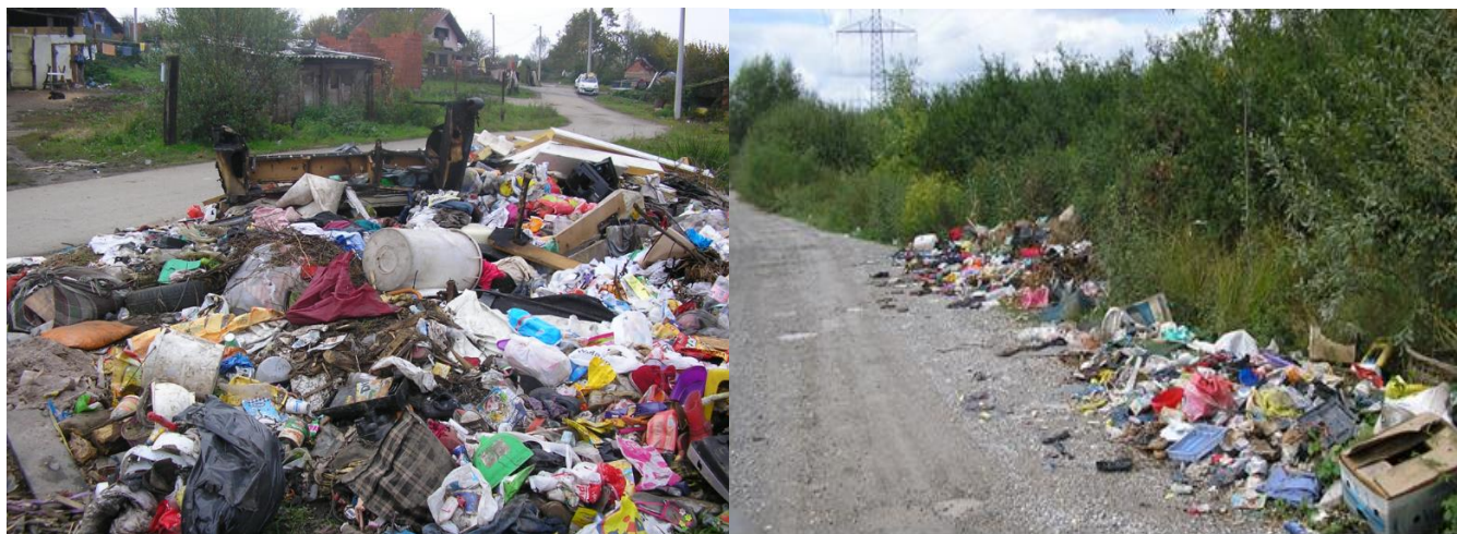
Slika 5. Odbačeni otpad na lokaciji Capraške poljane

Uklanjanje odbačenog otpada je tijekom 2018. godine provedeno u skladu s prijavama komunalnih redara i građana te kroz redovan odvoz miješanog komunalnog otpada, ukoliko su lokacije odbačenog otpada bile pozicionirane uz same posude za sakupljanje miješanog komunalnog otpada te je sastav otpada bio takav da ga se moglo odvesti u redovnoj liniji sakupljanja otpada.