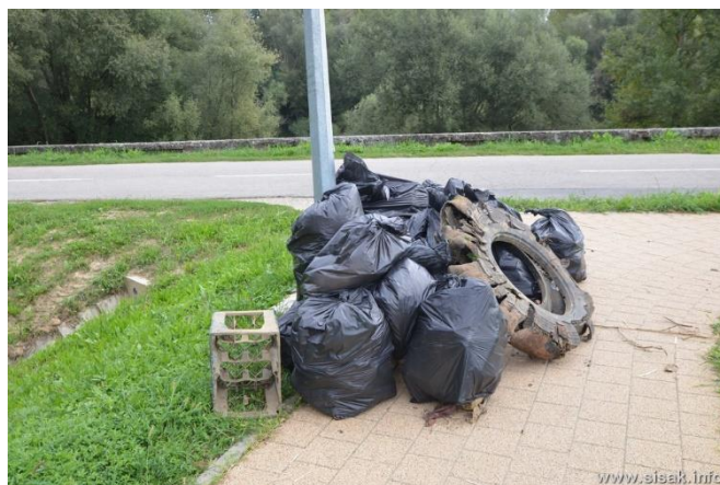
Slika 7. Zelena čistka na području Starog grada