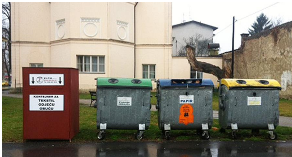
Slika 3. „Zeleni otok“