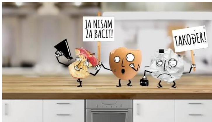
Slika 10. Edukativni video Fonda za zaštitu okoliša i energetska učinkovitost vezan za razvrstavanje otpada

Na web stranici GOS-a objavljen je edukativni video vezan za razvrstavanje korisnog otpada.