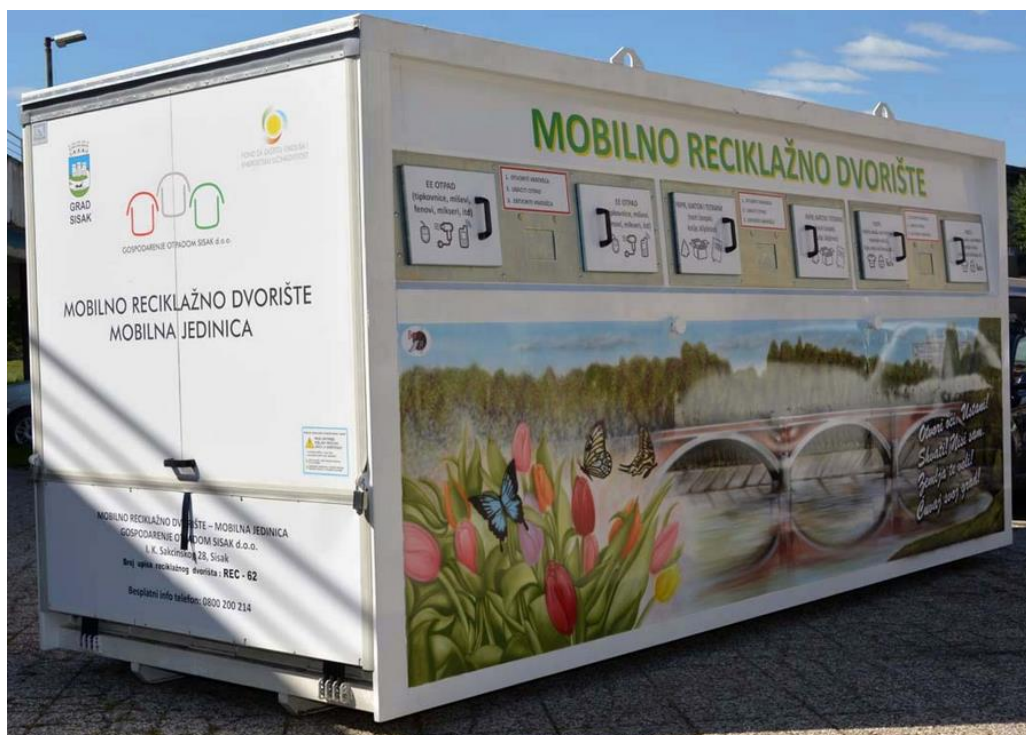
Slika 2. Mobilno reciklažno dvorište