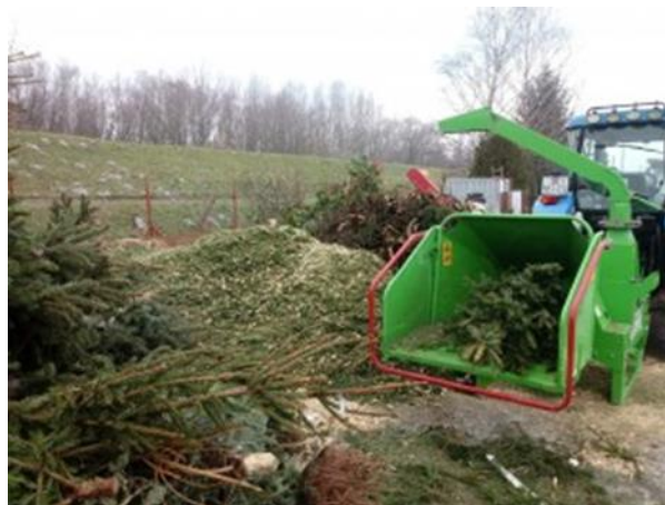
Slika 9. Odbačene drvene sječke i izrezivanje u drobilici za proizvodnju sječke