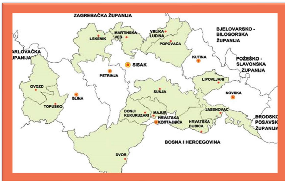
Slika 1. Lokalitet grada Siska u sklopu Sisačko-moslavačke županije i susjednih lokalnih i regionalnih jedinica

Grad Sisak kao sjedište Sisačko-moslavačke županije, nalazi se u njenom središnjem dijelu te graniči s ukupno jedanaest lokalnih jedinica: gradovima Petrinja, Kutina i Popovača te općinama Jasenovac, Lekenik, Martinska Ves, Velika Ludina, Lipovljani, Jasenovac, Sunja i Donji Kukuruzari. Grad Sisak ima površinu 422,75 km 2 odnosno zauzima 9,5% površine Sisačko-moslavačke županije i ima 35 statističkih naselja: Blinjski Kut, Budaševo, Bukovsko, Crnac, Čigoč, Donje Komarevo, Gornje Komarevo, Greda, Gušće, Hrastelnica, Jazvenik, Klobučak, Kratečko, Letovanci, Lonja, Lukavec Posavski, Madžari, Mužilovčica, Novo Pračno, Novo Selo, Novo Selo Palanječko, Odra Sisačka, Palanjek, Prelošćica, Sela, Sisak, Stara Drenčina, Staro Pračno, Staro Selo, Stupno, Suvoj, Topolovac, Veliko Svinjičko, Vurot i Žabno.