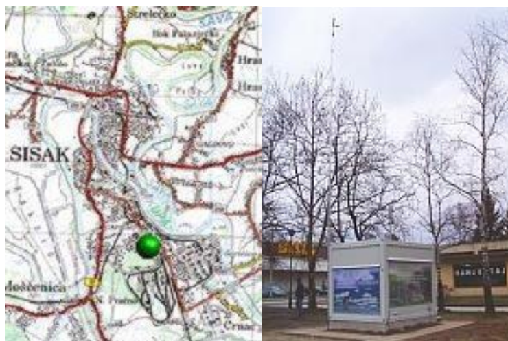
Slika 1. Prikaz lokacije AMP Sisak-1

Koncentracija onečišćujućih tvari na AMP Sisak-1 može se pratiti na sljedećoj web adresi: http://iszz.azo.hr/iskzl/postaja.html?id=162 . Onečišćujuće tvari koje su praćene tijekom 2019. godine na mjernoj postaji AMP Sisak-1 u Galdovu su: SO 2 -sumporov dioksid, NO 2 -dušikov dioksid (μg/m 3 ), CO-ugljikov monoksid (μg/m 3 ), H 2 S-sumporovodik (μg/m 3 ), C 6 H 6 -benzen (μg/m 3 ) te PM 10 (μg/m 3 )-lebdeće čestice.