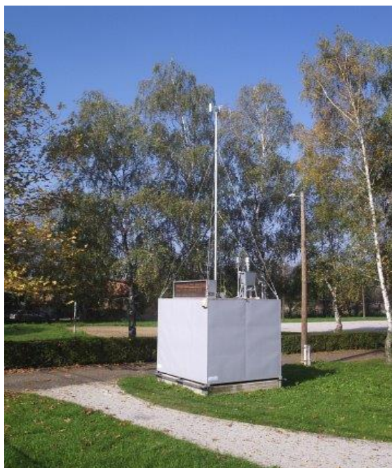
Slika 3. Prikaz AMP Sisak-2

Na slici 3. prikazana je AMP Sisak-2 u Galdovu.