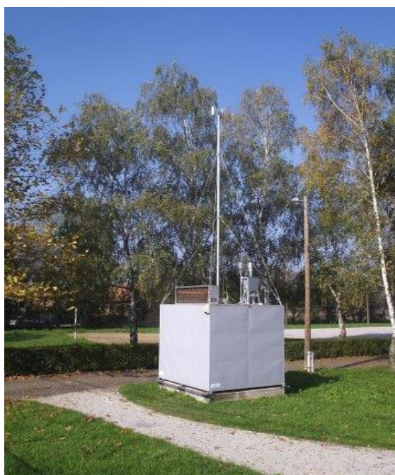
Slika 3. Prikaz AMP Sisak-2

Na slici 3. daje se prikaz AMP Sisak-2 u Galdovu.