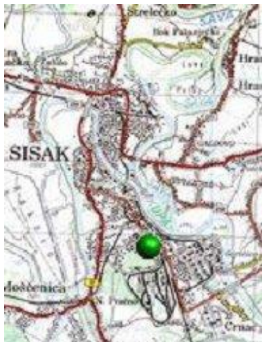
Slika 2 Prikaz lokacije AMP Sisak-1