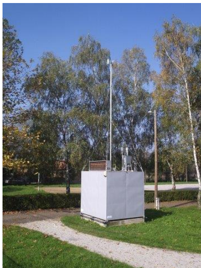
Slika 5. Prikaz AMP Sisak-2

Postaja za monitoring kvalitete zraka u originalnom izotermičkom skloništu je modularnog tipa. Instrumenti rade na osnovu automatskih referentnih metoda navedenim u Pravilniku o praćenju kakvoće zraka („Narodne novine” br. 3/13). Karakteristike mjernog sustava prikazane su u tablici 5, a podaci o mjestnoj postaji u tablici 6.