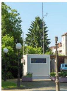
Slika 7 AMP Sisak-3

Mreža za kontinuirano praćenje kvalitete zraka AMP Sisak-3 je u sklopu Mreže za kontinuirano praćenje kvalitete zraka Sisačko-moslavačke županije. U tablici 14. dani su metapodaci za mrežu i mjernu postaju AMP Sisak-3.