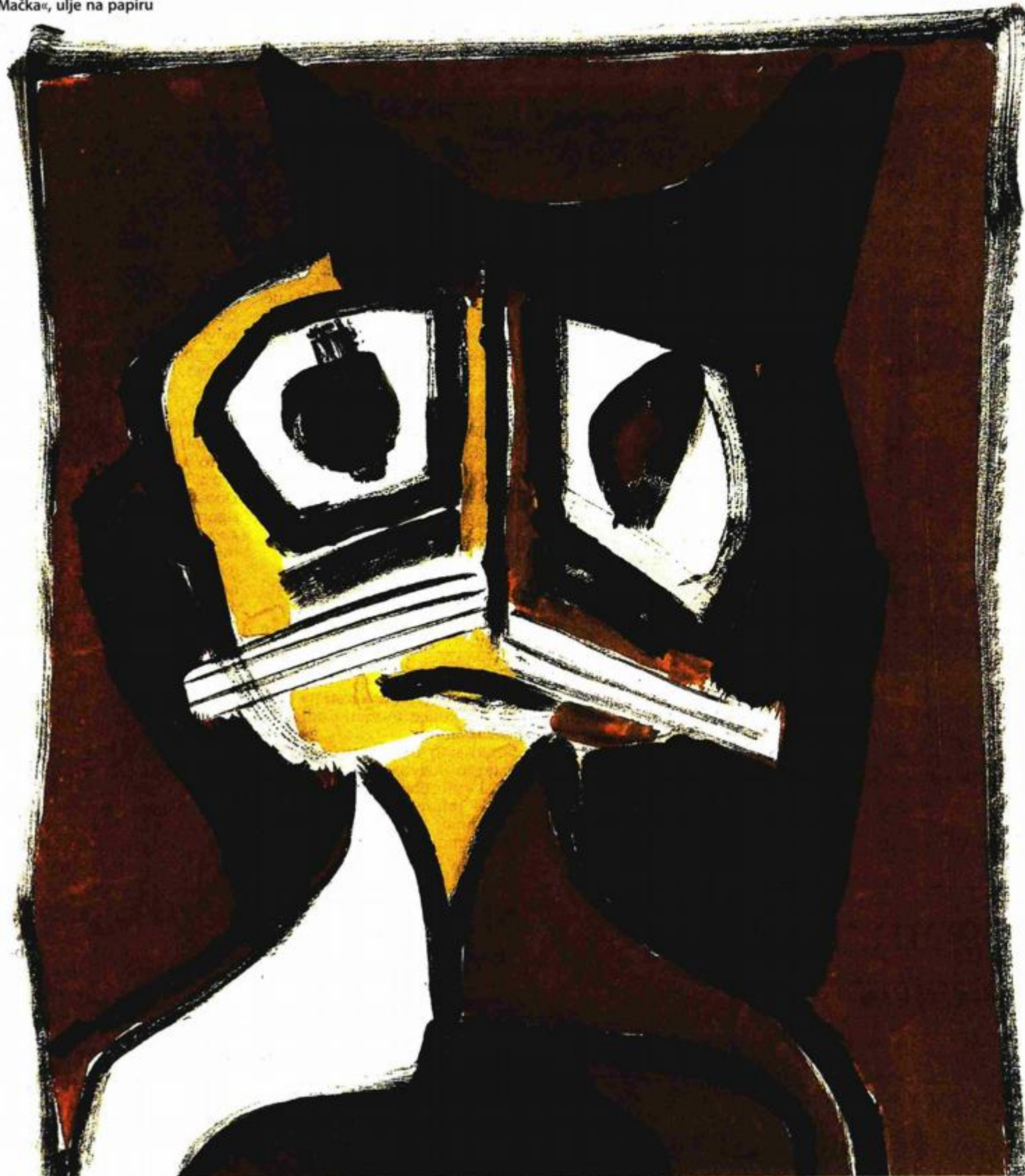
»Mačka«, ulje na papiru

Evidencijski broj / Article ID: 11541802 Vrsta novine / Frequency: Dnevna Zemlja porijekla / Country of origin: Hrvatska Rubrika / Section: