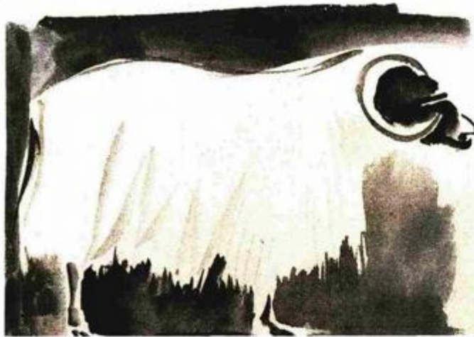
»Ovca«, kombinirana tehnika