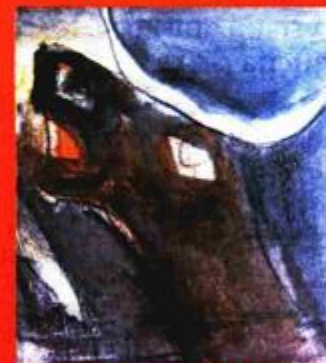
»Agresor«, kombinirana tehnika